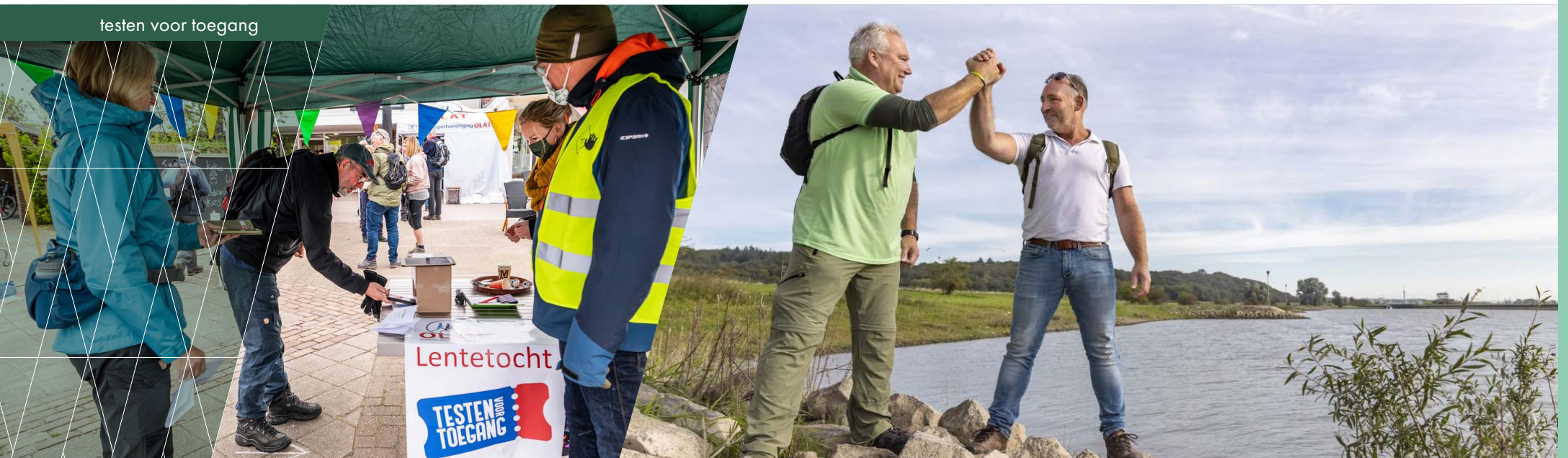
testen voor toegang

Met veel enthousiasme, daadkracht en deskundigheid geven zij invulling aan de uitvoering van ons beleid. Net als in 2020 gebeurt dat grotendeels vanuit huis, onder soms moeilijke omstandigheden. Onze dank voor zoveel flexibiliteit en doorzettingsvermogen is groot.